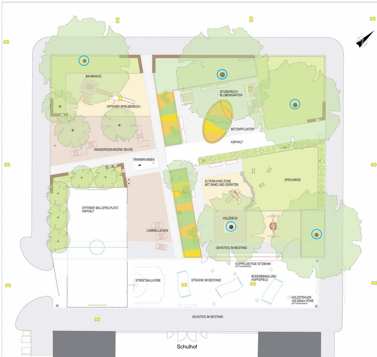
Entwurf Klopsteinpark Plan Nr. 104-20 /08 vom 05.05.2008 Verkleinerung