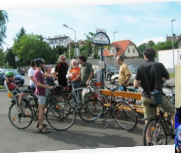
Zu Fuß, mit dem Rad und den Öffis - nachhaltig unterwegs in Liesing.