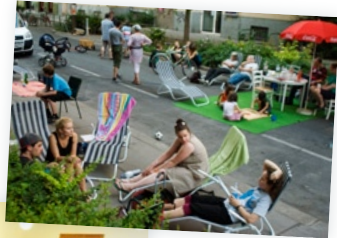
AsphaltpiratInnen erobern die Straße.