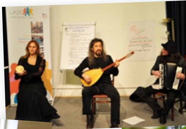
Interkulturelle Begegnungen schaffen neue Perspektiven.