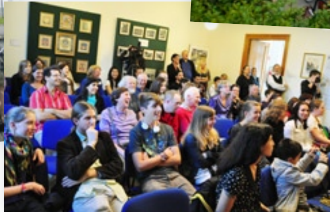
Lustvolle Diskussionen in der LA21 Plus.