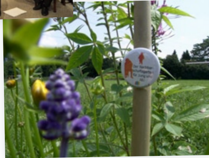
Nachbarschaftsgarten für Alt und Jung: gemeinsam garteln in der Donaustadt.