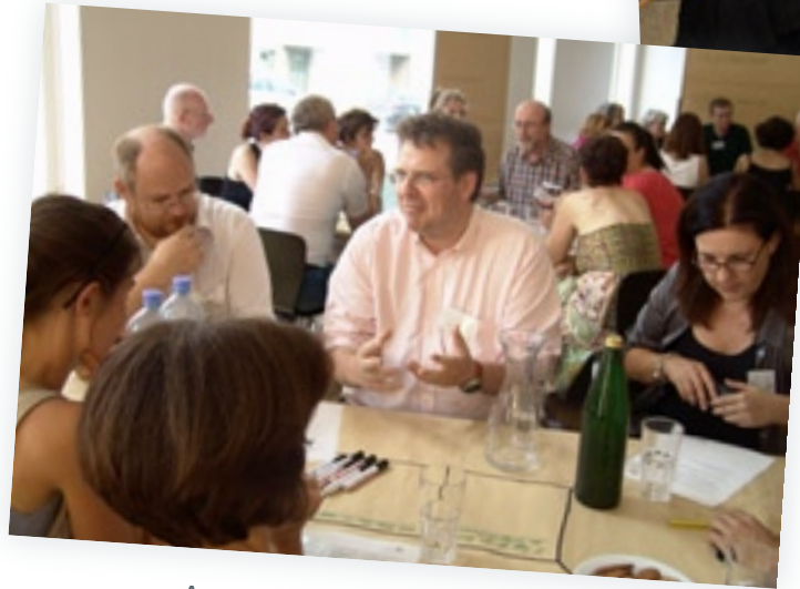
Agendaforum: Stadtviertel und leere Geschäftslokale blühen auf!