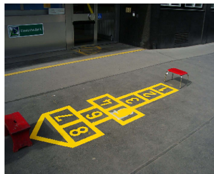
... und gut trocknen lassen!

In diesem Kooperationsprojekt arbeiten verschiedenen Institutionen zusammen – Bezirksvorstehung, Parkbetreuung, Streetwork Wieden, Stadtgartenamt und AgendaWieden. Diese interdisziplinäre Gruppenzusammensetzung inkl. der Mitwirkung von EntscheidungsträgerInnen hat sich als äußerst produktiv erwiesen, da viele Kompetenzen gebündelt und Maßnahmen dadurch effizient im Sinne der Ziele des Kooperationsprojektes umgesetzt werden können.