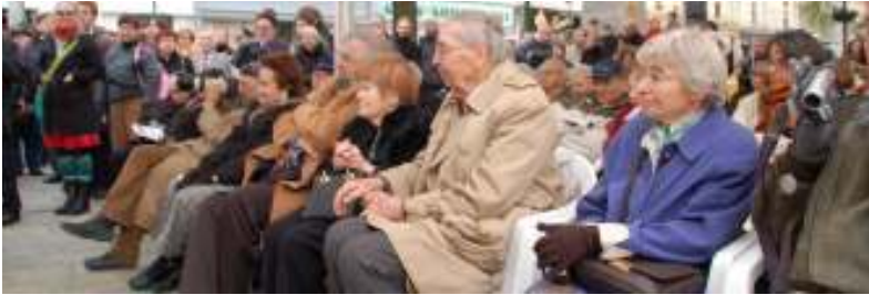
Ehrgäste der Enthüllungsfeier waren ehemalige Bewohnerinnen und Bewohner aus der Servitengasse, die Dank der Unterstützung des Jewish Welcome Service zur Feier nach Wien eingeladen werden konnten.