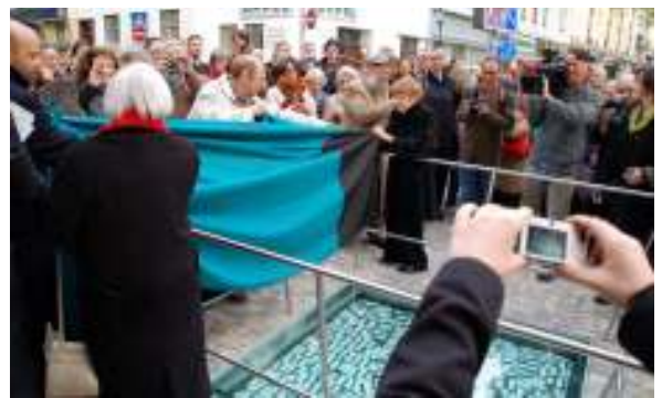
Höhepunkt der Veranstaltung: Die Enthüllung des Denkmals durch ehemalige Bewohner der Servitengasse