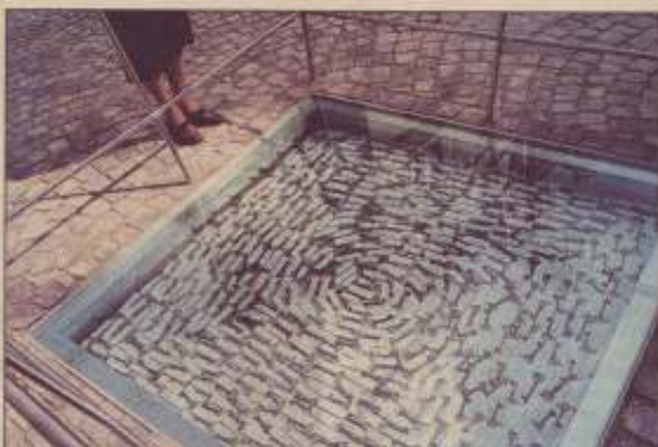
426 Schlüssel stehen für 426 Menschen, die Opfer des Nationalsozialismus wurden. Das Mahnmahl wurde am Dienstag enthüllt.