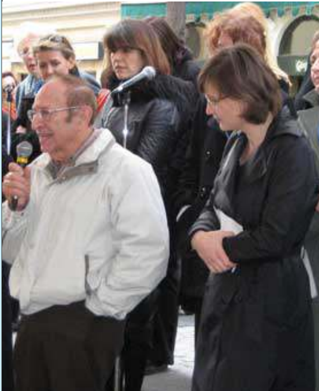
"die jüdische" 13.04.2008 10:45

mit der traurigen Vergangenheit der eigenen Wohngegend in der Nazizeit beschäftigt. Für mich persönlich war die Enttäuschung meines Großonkels ein Startpunkt. Als er im Jahr 2000 nach 55 Jahren zum ersten Mal wieder in Wien war, schockierte es ihn richtig, dass es so wenige Plätze gab, an denen dem ehemals blühenden Leben der ausgelöschten Kultur gedacht wurde. Und er hatte Recht; neben den Tafeln für ehemalige Tempel oder am Wohnort von berühmten Persönlichkeiten fanden sich nur ganz vereinzelt Zeichen des Gedenkens in seinem Heimatbezirk.