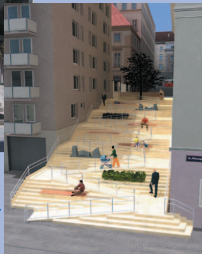
rechts: So soll die Thurnstiege in Zukunft aussehen – hell, freundlich, für alle BenutzerInnen zu überwinden.