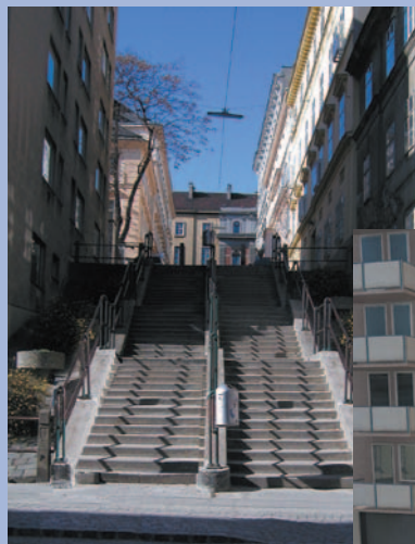
links: Die Thurnstiege bisher: Die 100 Jahre alte Stiege ist in die Jahre gekommen.

Baugrunduntersuchungen, Vermessung, Detailbesprechungen mit den betroffenen Dienststellen, Erstellung der Ausschreibung und der Ausschreibungsplanung